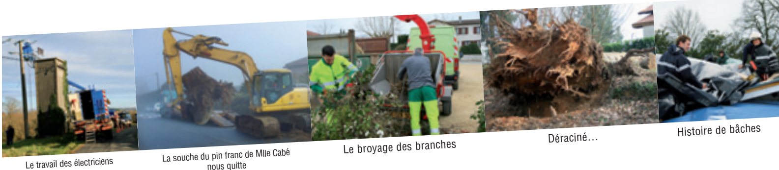
Le travail des électriciens