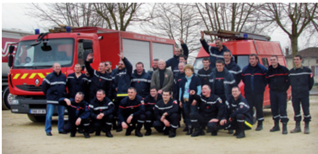
Pompiers de Vendée avec les montfortois : le départ

Le 24 janvier, à 3 heures débutait la tempête KLAUS. Quelques semaines plus tard, retour en mots et en images sur les petites tristesses et les grandes joies de cette journée particulière.