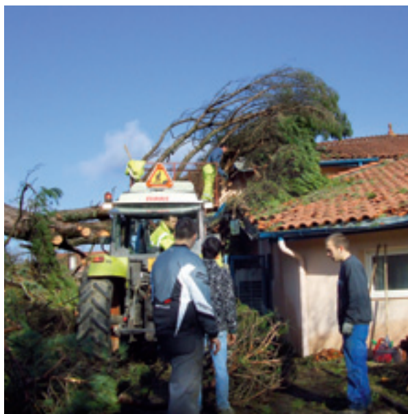
De jeunes volontaires en appui du personnel communal